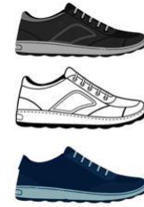
** Sólo fotografía referencial **