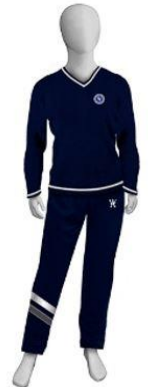
** Sólo fotografía referencial **